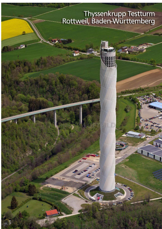
Thyssenkrupp Testturm Rottweil, Baden-Württemberg

2000 Jahre alt ist die älteste Stadt Baden-Württembergs – und erfindet sich dabei immer wieder neu. In einer Führung entdecken wir die historische Innenstadt mit ihrer faszinierenden Geschichte, tief verwurzelten Traditionen und hören spannende Geschichten und interessante Anekdoten aus der ältesten Stadt Baden-Württembergs.